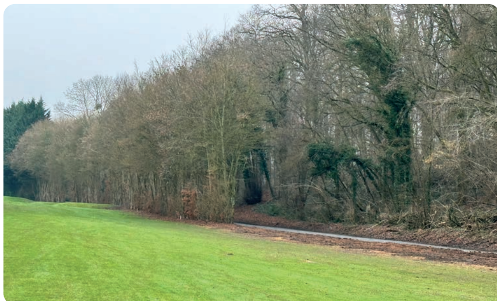
Le trou n°18 après l'abattage des arbres

Les végétaux sont jeunes et fragiles, je compte sur votre attention et votre bienveillance au cours des prochains mois.